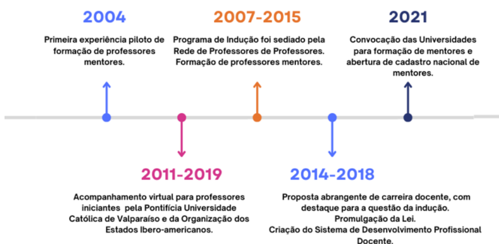
Figura 3: Linha do tempo com as principais ações antes e depois da criação do SDPD

Para ilustrar o percurso das experiências que antecederam a política de indução vigente, foi elaborada uma linha do tempo com as principais ações antes e depois da criação do SDPD, conforme mostra a figura a seguir.